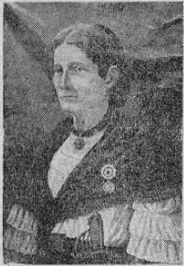
Fotografía de la heroína tomada especialmente para MUNDO FEMENINO por el señor don Tomás Salazar de la ciudad de Alajuela. Oleo ejecutado por el artista nacional don Manuel Zúñiga Azofeifa, nieto de la heroína tica.

Los filibusteros al ver rodar a su jefe, buyeron en desbandada, aterrorizados del valor y la serenidad de sus "pie en el suelo". Entonces doña Pancha, desafiando los silbantes disparos que rasgaban el silencio casi conventual de la ciudad rivense, corrió hacia la artillería, y ayudada