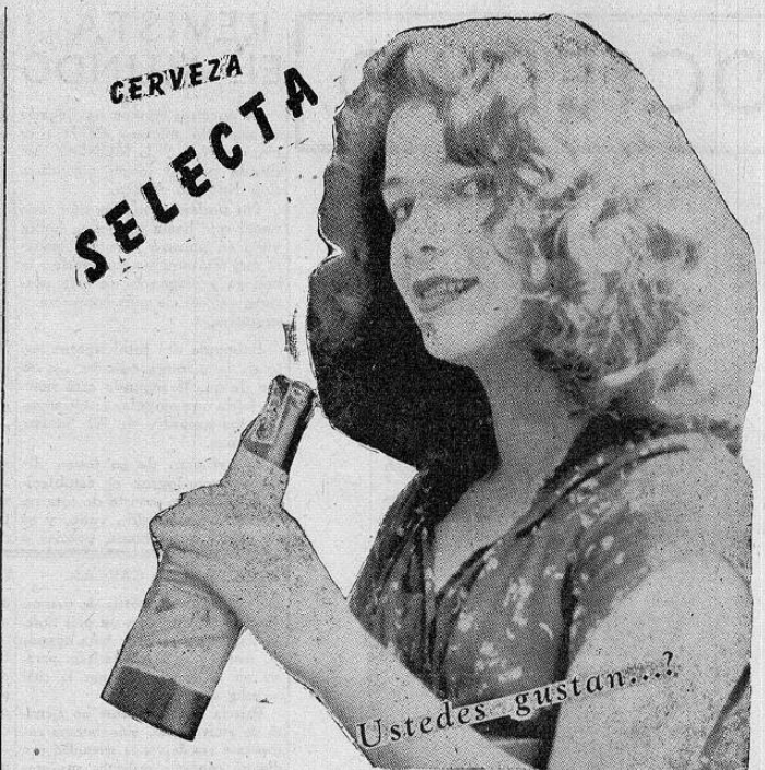
Ustedes gustan...? SELECTA la cerveza imprescindible en toda fiesta

Son 74 los hospitales para indígenas en los Estados Unidos, todos ellos estratégicamente situados, entre las más densas masas de población autóctona. De sus 3.600 camas, 1000 son para tuberculosos; para cada 1000 indios existen 8 camas de medicina general o quirúrgicas; por otra parte, sólo hay 4 camas por cada 1000 habitantes del país en los hospitales generales. El hospital de Tacoma, Estado de Washington, con un costo de un millón y medio de dólares, es uno de los principales del país para atender el terrible mal de la tracoma entre los Píeles Rojas. La terapia ocupacional es una de las características más importantes de todos estos hospitales. La tuberculosis y la tracoma son